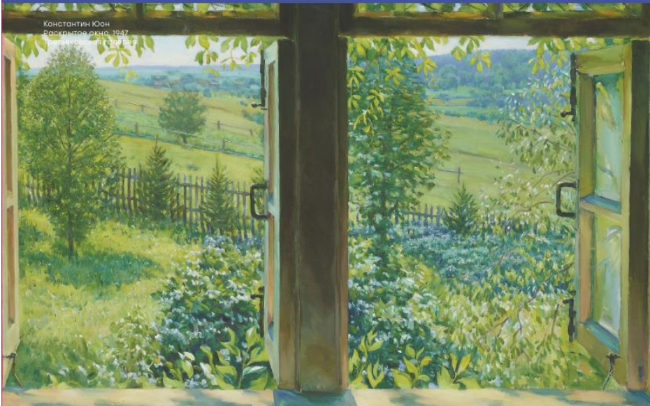
Константин Юон Раскрытое окно. 1947

Посетив выставку, мы окунулись в мир прекрасных картин, почувствовали глубину мысли великих живописцев