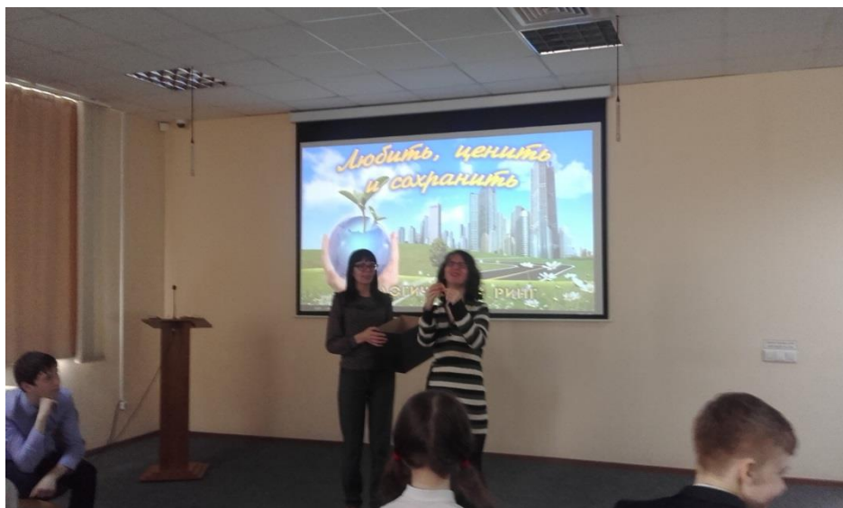
Председатель жюри подвел итог нашего экологического ринга.