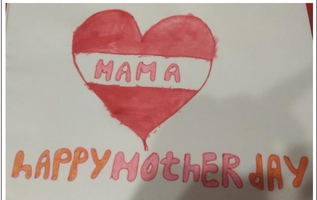
Вычужанин Даниил, 5Г класс (Открытка для мамы)