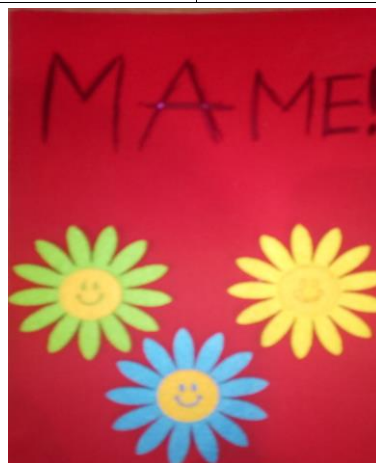
Рачук Роман, 5Г класс (Открытка для мамы)