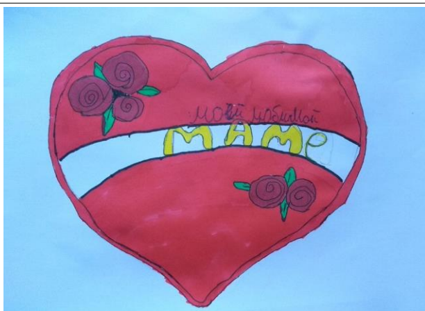
Савков максим, 5Г класс (Открытка для мамы)